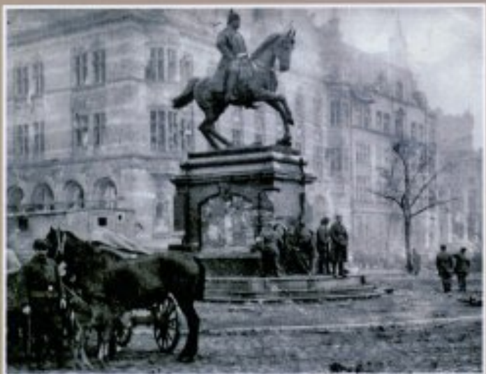
Военнослужащие 354-ой стрелковой дивизии у памятника в Берлине. 1945 г.

Над буклетом работали: Т.А. Евневич, С.В. Беляева, О.О. Вашаева, О.В. Вовкотруб, Л.В. Комолова, Л.Н. Кушкова, С.В. Петрина, О.В. Сиротин