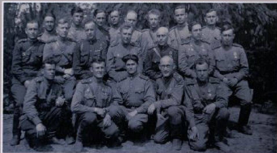
Группа работников политотдела 354-ой стрелковой дивизии