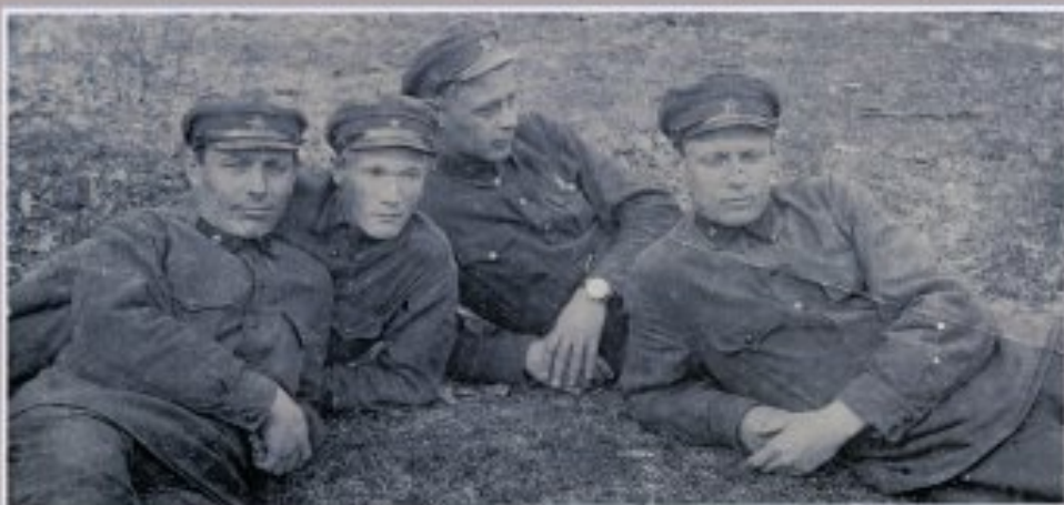
Группа командиров 354-ой стрелковой дивизии