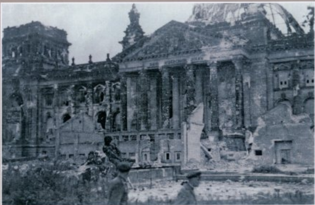
Рейхстаг. 1945 г.

Над буклетом работали: Т.А. Евневич, С.В. Беляева, О.О. Вашаева, О.В. Вовкотруб, Л.В. Комолова, Л.Н. Кушкова, С.В. Петрина, О.В. Сиротин