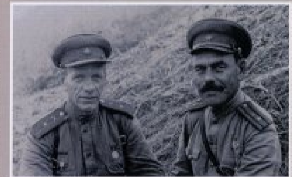
Осень и начало зимы дивизия провела в тяжелых и кровопролитных боях под Ржевом. К середине декабря была сильно обескровлена и ее вновь отправили в резерв. Но уже 8 февраля 1943 года дивизия была включена в состав 65-й армии генерала П.И. Батова и переброшена на станцию Елец. 25 февраля дивизия включилась в наступательные бои, в результате которых образовалась Курская дуга.