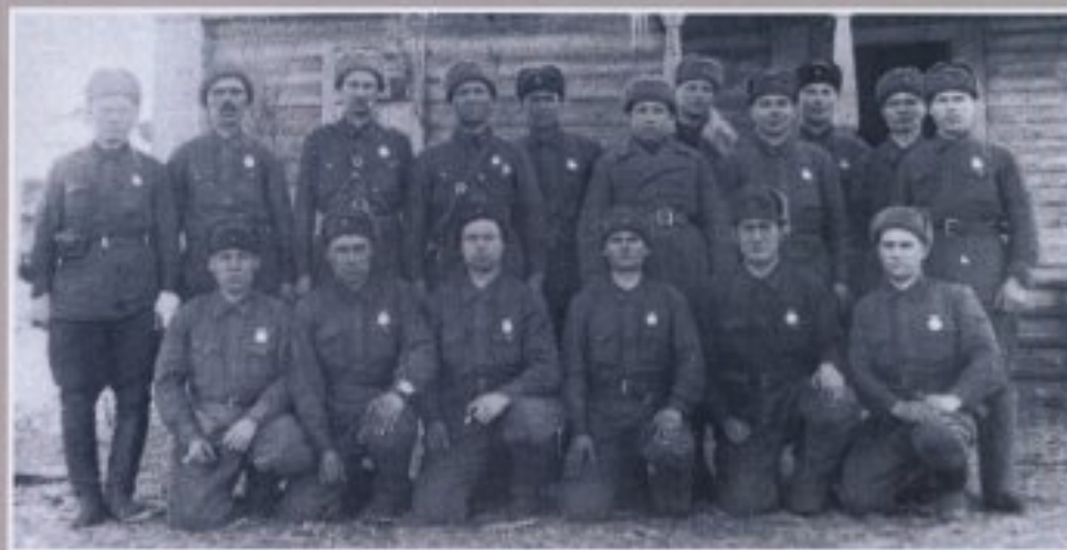
Воины 354-ой стрелковой дивизии, награжденные медалью «За отвагу» за успешные боевые действия под Москвой в 1941 г.

29-30 ноября 1941 г. первые из 16 эшелонов с частями 354-ой стрелковой дивизии прибыли на подмосковные станции Химки и Сходня, а в ночь на 1 декабря 1941 г. дивизия заняла позиции в 1-ой линии обороны столицы на 41-м километре Ленинградского шоссе у станции Крюково. Уже 2 декабря солдаты приняли первый бой в районе села Матушкина. За первые шесть дней ожесточенных боев из строя вышло более 1000 человек, 148 из них были убиты. А 7 декабря дивизия перешла в наступление и продвинулась вперед на 4 километра. Это была первая скромная победа наших земляков.