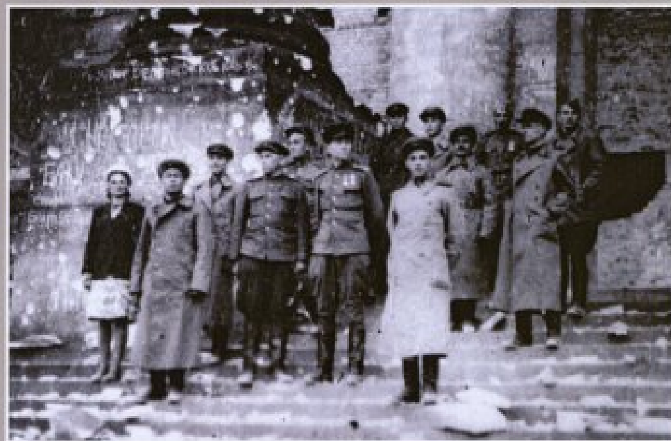
Бойцы 354-ой стрелковой дивизии на ступенях Рейхстага в Берлине