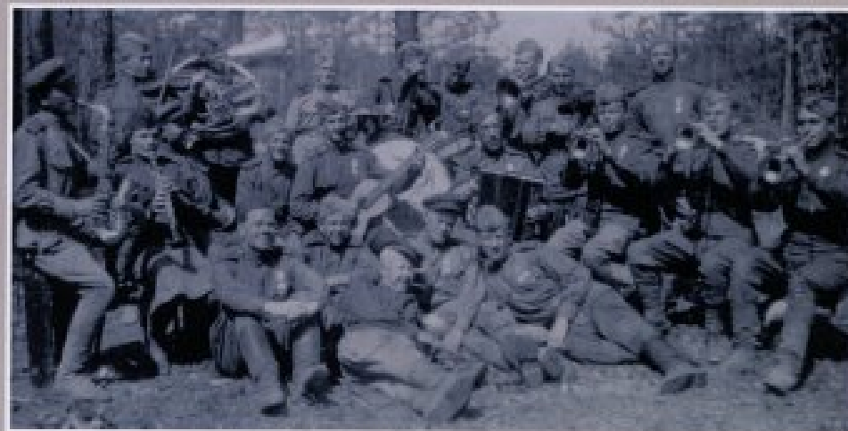
Ансамбль 354-ой стрелковой дивизии в Белоруссии. 12 июня 1944 г.