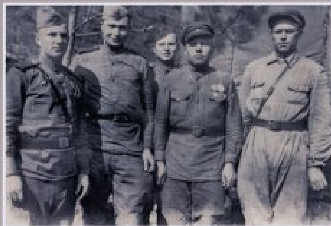
Бойцы-артиллеристы 354-ой стрелковой дивизии. 1943 г.

26 августа 1943 года 354-я перешла в наступление в районе Севска, и через месяц ожесточенных боев вступила на территорию Белоруссии. Далее было форсирование Днепра, освобождение Речицы и Гомеля, а 14 января 1944 г. дивизия освободила г. Калинковичи. С этого дня 354-я стрелковая получила почетное наименование «Калинковичская».