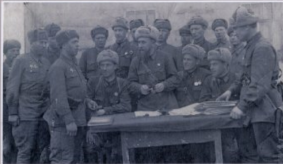
Вручение партбилетов, принятым в партию бойцам 921-го артполка 354-ой стрелковой дивизии. 1 апреля 1943 г.